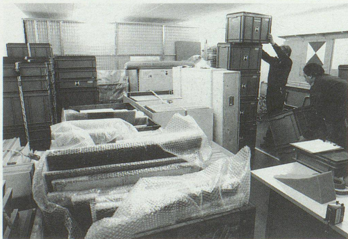
Einer der KGS-Schutzräume ist schon fast voll.