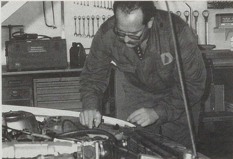
Jedes Fahrzeug wird bei der Übernahme auf seinen Zustand überprüft.

Es waren drei Teams an der Arbeit. Die ankommenden Fahrzeuge wurden von einer ersten Equipe, bestehend aus zwei Gr. C. Trsp., in Empfang genommen. Dort wurden die Daten aufgenommen, inkl. Tankkontrolle. Die zweite anspruchsvolle Position bestand aus der mechanischen Zustandsprüfung. Dieses Team, bestehend