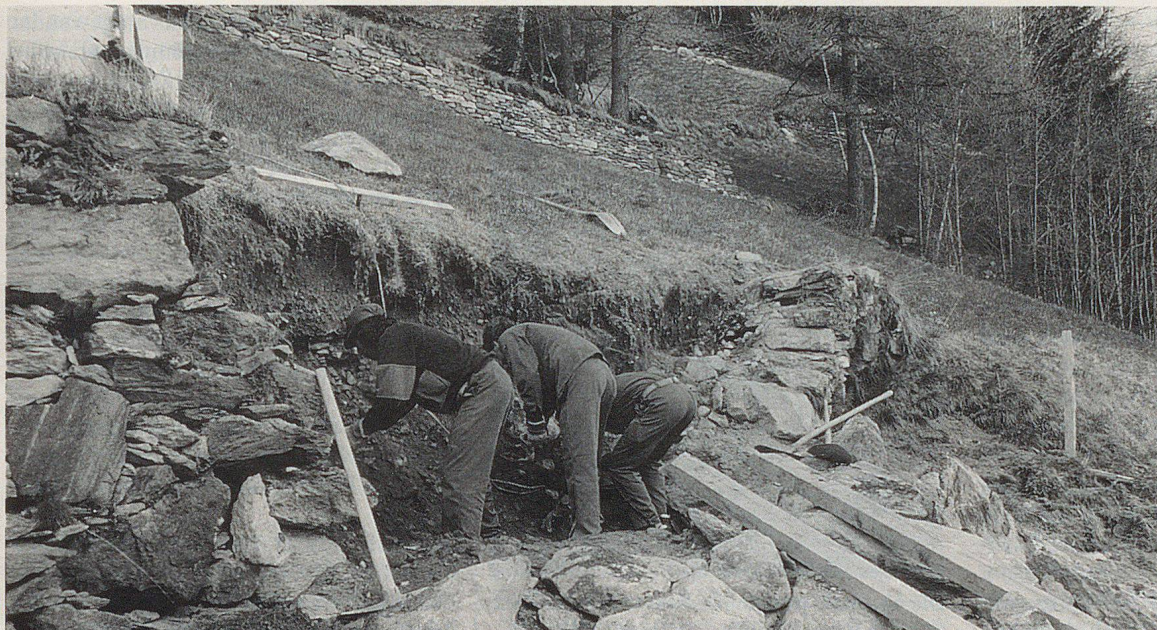
Eine teilweise zerstörte Trockensteinmauer wird instandgestellt.