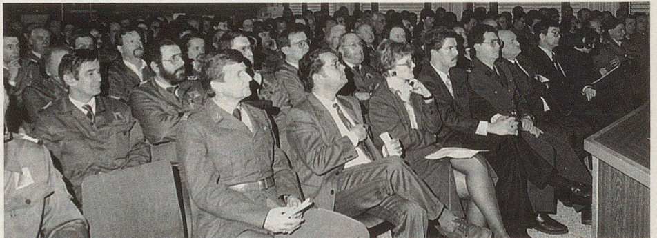
Plus de 180 personnes (invités et cadres de l'OPC) ont participé au rapport annuel de la PCI lausannoise.