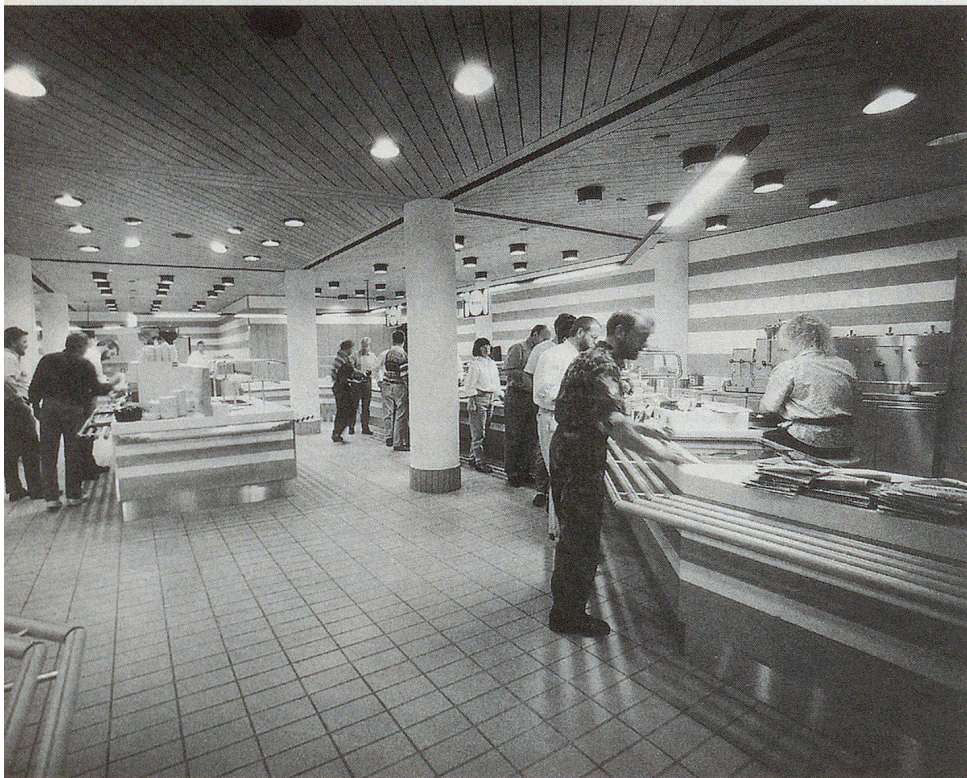
Sauber, praktisch und rationell: die Essensausgabe im Self-Service-System.

Der Bau des Zivilschutzausbildungszentrums wurde in zwei Schritten geplant. 1985 wurden die Bauten der ersten Etappe eingeweiht. Diese umfassen im wesentlichen ein Schulgebäude mit zwölf Klassenzimmern und einem Theorieraum für 90 Personen, ein Zentralgebäude mit dem Verpflegungsbereich und einem Hörsaal für 170 Personen sowie ein Unterkunftsgelände mit rund 100 Zwei-Bett-Zimmern. Der jetzt eingeweihte Erweiterungsbau rundet das bestehende Gebäude ab. Er wurde nach bauökologischen Grundsätzen gebaut und ist in die Landschaft integriert. Der Neubau enthält einen Schultrakt mit zwölf Klassenzimmern und einem Theorieraum. Im Untergeschoss befinden sich zwei Übungskommandoposten. Das obere Stockwerk mit sechs Klassenzimmern und einem Kursleiterbüro ist so konzipiert, dass es als selbständige Kurseinheit auch Dritten zur Verfügung gestellt werden kann. Benützer dieser Einheit ist unter anderem