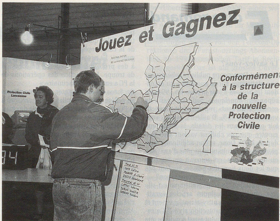
Un jeune visiteur reconstitue le puzzle des groupements des communes genevoises.

Il est vrai qu'à Lancy, l'état-major est totalement opérationnel; il dispose de constructions et des abris nécessaires à la mise en sécurité de sa population. Pourtant, la commune a décidé d'appliquer dans son ensemble un concept de sécurité. Cette sécurité civile lancéenne existe bel et bien, puisqu'un accord réglant toutes les modalités de qui fait quoi et commande quoi a été signé en mai dans une convention. Cette convention unit les sapeurs-