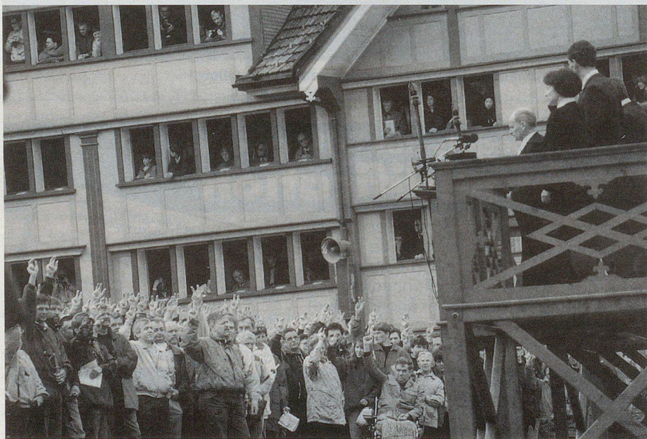
Le nouveau landamann est élu.

Ajoutons, pour terminer, que ces deux demi-cantons ont un charme indéfinissable et que l'accueil de la population est particulièrement chaleureux. ▣