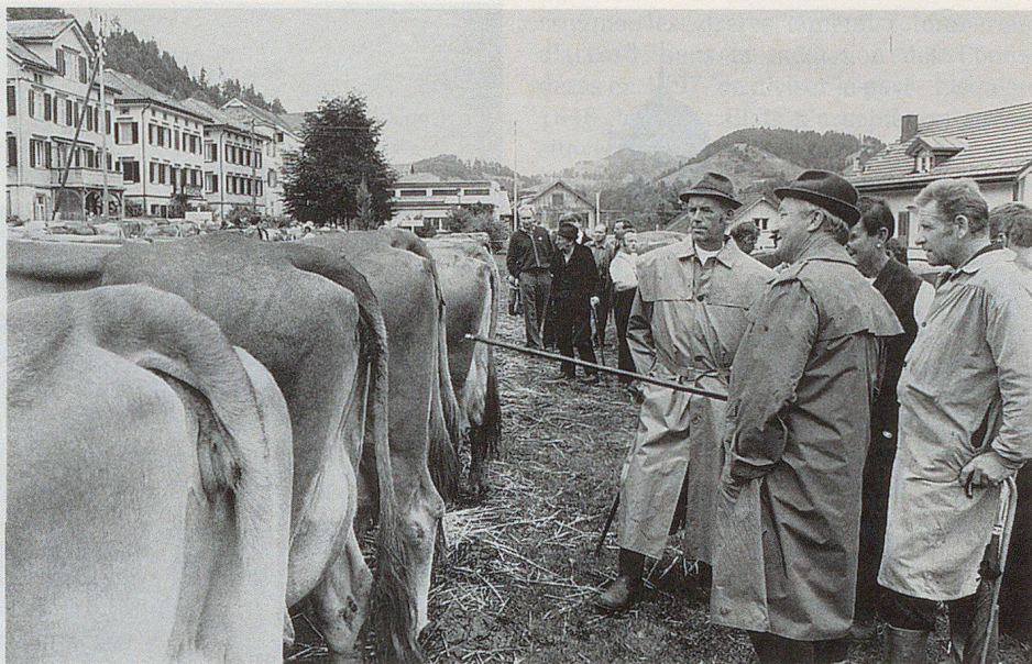
Die Viehschau in Urnäsch zeugt von einem gesunden Bauernstand.

Um manche Heiler ranken sich geradezu wundersame Geschichten. Eine Erzählung, die allerdings schon rund 50 Jahre zurückliegt, möge dies aufzeigen: In Teufen lebte ein Doktor Schnider, der angeblich wahre Wunder wirkte. Er behandelte alle Leute, ob arm oder reich. Wenn ein Patient ihm klagte, er habe kein Geld, verzichtete er grosszügig auf das Honorar. Aber wehe, wenn der Patient ihn anbelagert hatte. Wollte er in Teufen wieder die Bahn besteigen, blieb er wie angewurzelt stehen und konnte keinen Schritt mehr vorwärts tun. Die Bahnbediensteten wussten Bescheid und schickten ihn zu Doktor Schnider zurück, um die Rechnung zu bezahlen. Ob die Geschichte wahr ist, lässt