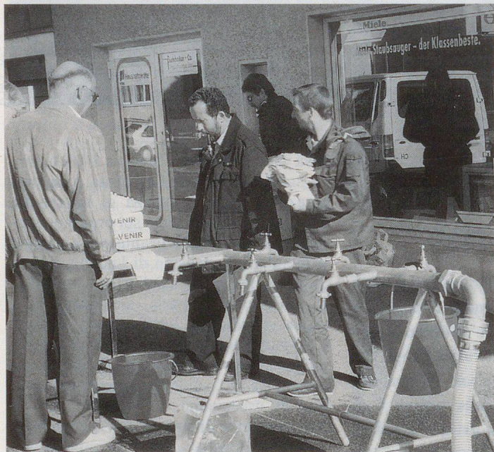
Notzapfstelle nach dem Hol-Prinzip.

Organisation und Vollzug sind jedoch an die Kantone delegiert. Aufgaben des Kantons sind insbesondere die Erstellung eines Inventars der Wasservorkommen für Notlagen sowie die Beschaffung und Lagerung von schwerem Material. Auf Stufe Gemeinde werden die Planungen und Massnahmen vorbereitet. In Wallisellen – und das dürfte auch in anderen Gemeinden so sein – ist dazu eine enge Zusammenarbeit der Gemeindewerke mit dem Zivilschutz erforderlich. ▢