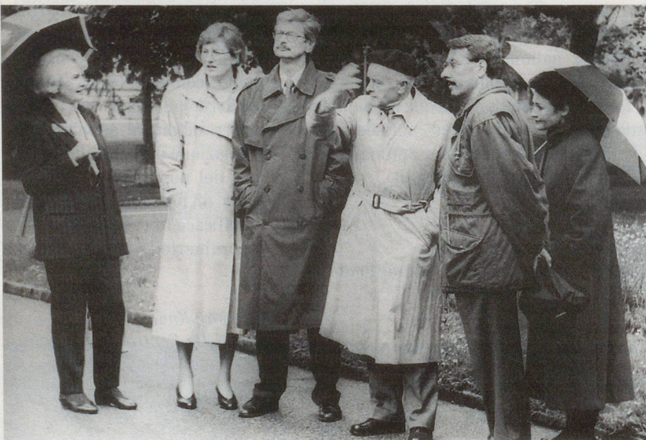
Zofingen war eine Reise wert. Die Führung durch die historische Altstadt öffnete die Augen für bauliche Kultur.

Allen Belangen, die Willy Loretan im Interesse der Öffentlichkeit wichtig scheinen, nimmt er sich auch an. So war er von 1982 bis 1992 Präsident der Schweizerischen Stiftung für Landschaftsschutz und Landschaftspflege. Als Präsident der Parlamentarischen Gruppe für Sicherheitspolitik der Vereinigten Bundesversammlung befasst er sich sehr eingehend mit Fragen der Si-