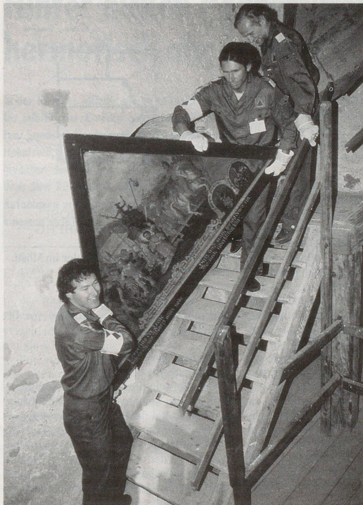
KGS-Personal aus Winterthur evakuierte unter anderem während der zweitägigen Übung die Bilder in ein neues Depot.

Es werden zwei Kurstypen angeboten. Für Teilnehmer aus kleinen Gemeinden besteht die Möglichkeit, den Kurs für Personen aus ländlichen Gebieten zu besuchen. Für Dienstchefs aus grossen Zivilschutzorganisationen empfiehlt es sich, den Kurs