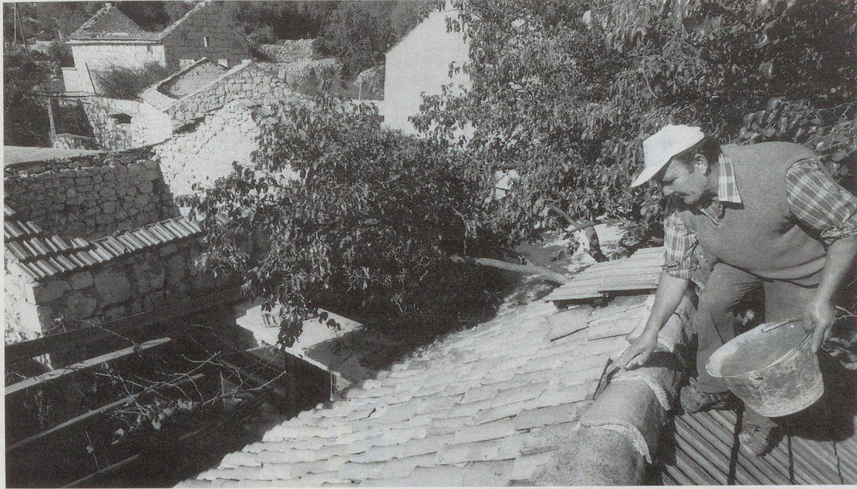
Wiederaufbau in Ex-Jugoslawien. Unter der Leitung des SKH werden Infrastrukturen und auch ganze Dörfer im Rohbau wieder aufgebaut.