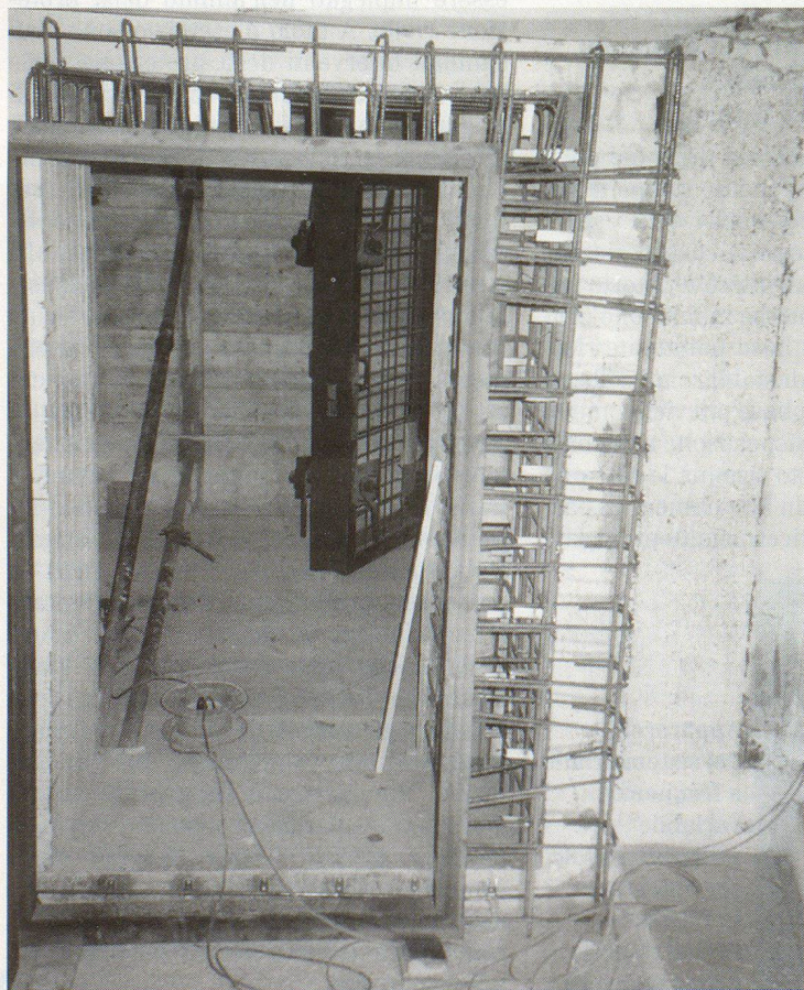
Nachträglicher Einbau einer Panzertüre.

Die Anforderungen in die TWE 1997 Anlagen wurden bewusst so angesetzt, dass mit der vorhandenen Substanz ein genügend hoher, ausgewogener Schutz gegen Waffenwirkungen erreicht wird. Sie wird auf das Notwendige ausgerichtet. Daraus folgend, sollten die Kosten einer Erneuerung jene eines entsprechenden Neubaus wesentlich unterschreiten.