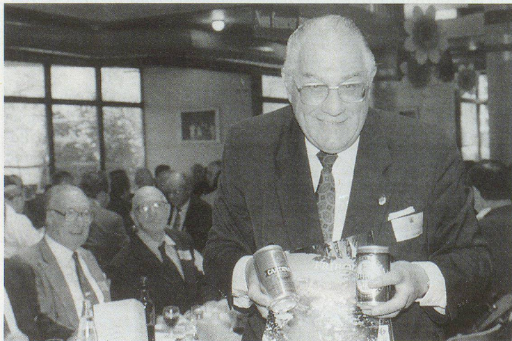
La promotion du Pays de Fribourg, vue par Francis-C. Lachat, président de l'UFPC.

poursuit ses efforts dans le domaine de l'information, a encore déclaré Paul Thüring. A ce sujet, la PCI et l'armée seront présentes, ensemble, lors de la prochaine exposition nationale.