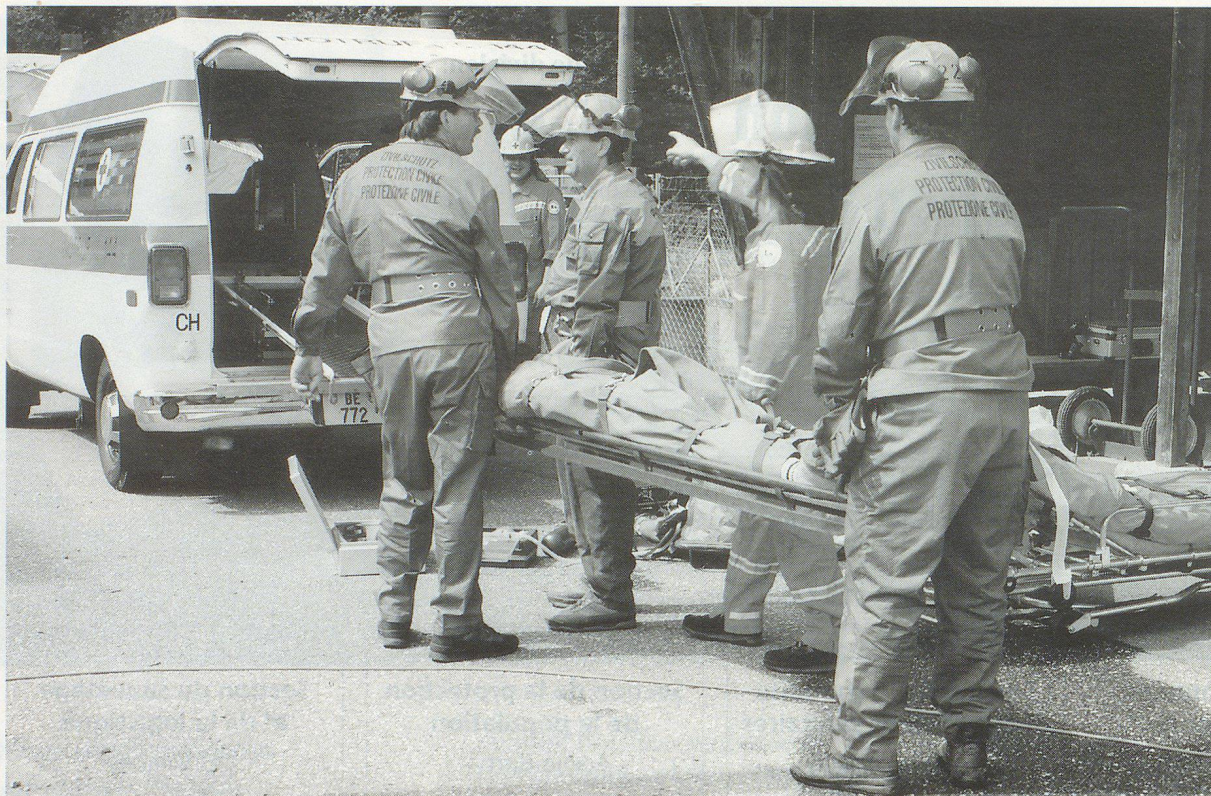
Organisation: par exemple le sauvetage.

domaine sanitaire et comprenant notamment l'élaboration d'une nouvelle réglementation relative au matériel de consommation lié au service sanitaire (médicaments, etc.).