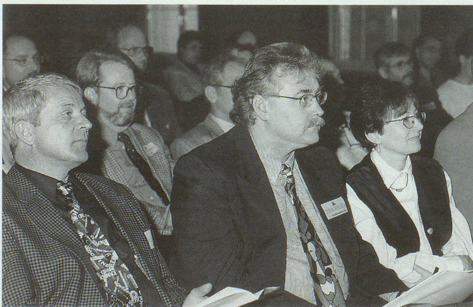
I delegati cantonali seguono attentamente le spiegazioni del responsabile delle finanze dell'USPC sul conto annuale dell'associazione.

Nell'anno in corso, malgrado le risorse finanziarie ridotte, l'associazione prosegue