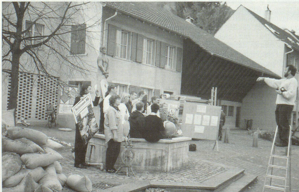
Bevor der erste Sandsack gesetzt wird, ist eine Orientierung über das Vorhaben angesagt.