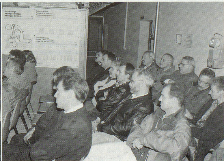
Eine grosse Schar interessierter Besucher liess sich über das Konzept der ZSO Stein am Rhein informieren.