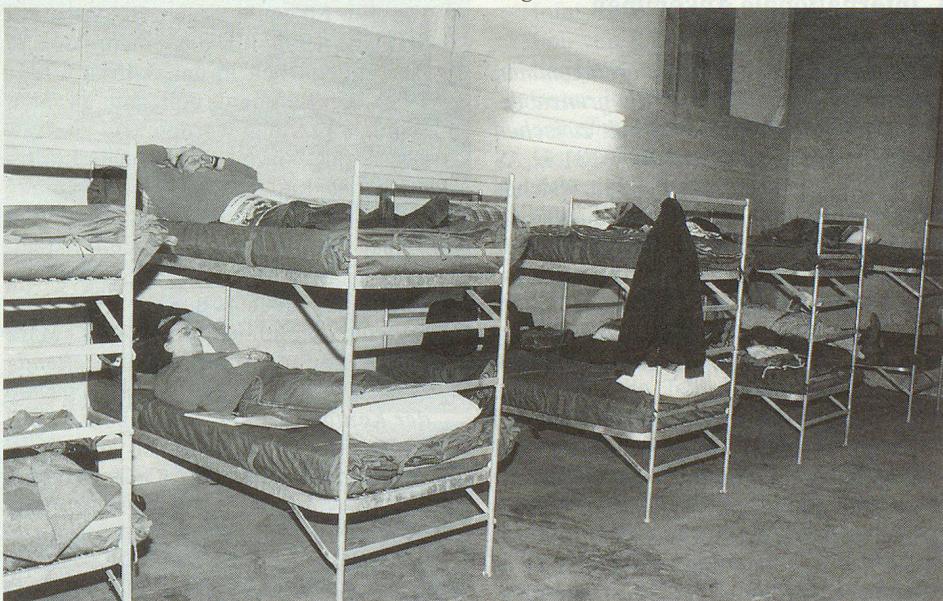
Teilansicht des Männerschlafrums im Betreuungszentrum Muttentz.