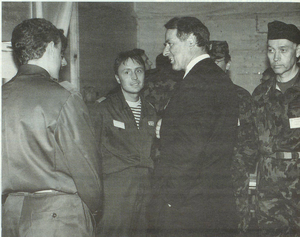
«Ihr leistet ausgezeichnete Arbeit!» Bundesrat Adolf Ogi mit Zivilschützern.