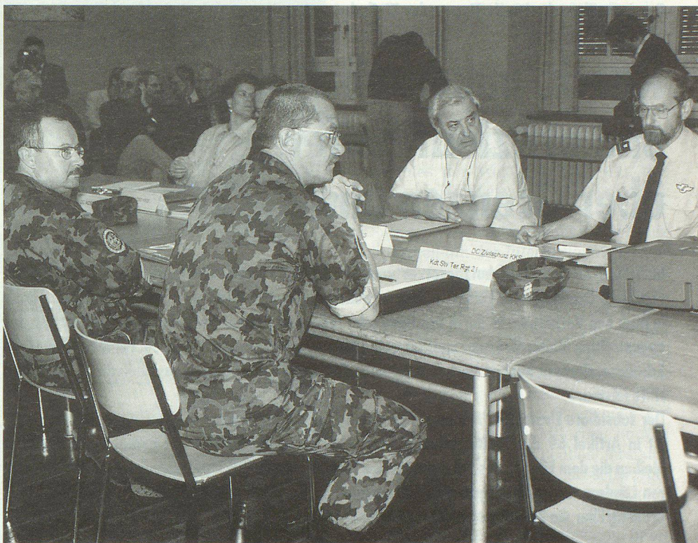
Am Abspracherapport nahmen Vertreter des Kantons, der betroffenen Gemeinden und der Einsatzkräfte teil.

In Liestal wurde diese Koordination Bun-