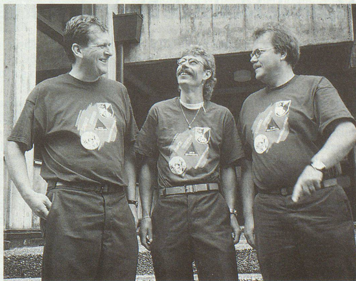
Für den Einsatz in Bristen entwarfen die Oberdörfer Zivilschützer eigens ein Tenü.