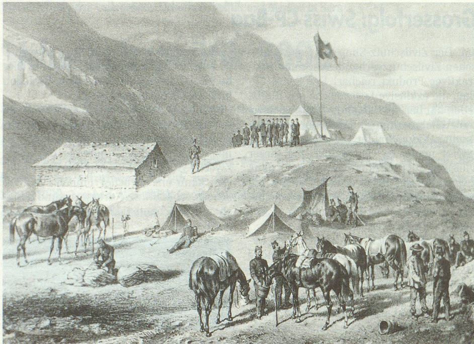
Der Fundus des Armeemuseums soll weit in die Schweizer Geschichte zurückreichen. Auf unserem Bild das Gemälde eines Heerlagers auf der Furka.