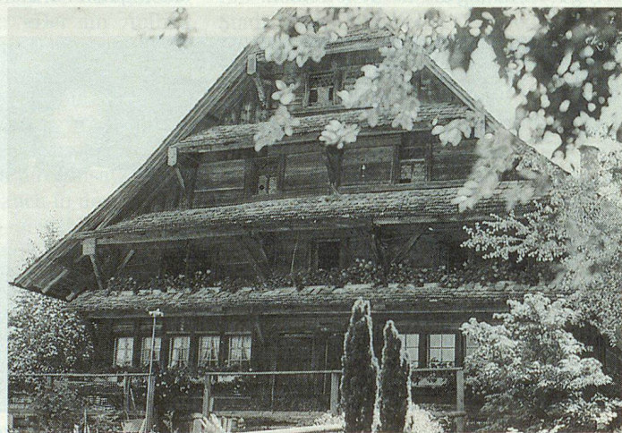
Der im Jahr 1679 erbaute Blockständerbau im Unterdorf.