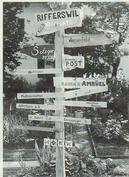
In Rifferswil sind sogar die Wegweiser anders.