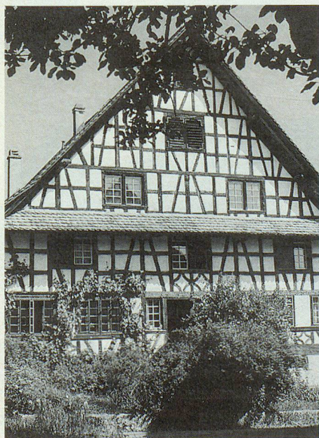
Der schönste Riegelbau von Rifferswil mit der Giebelatierung 1788.

Rifferswil hat Geschichte. Aber zur hohen Auszeichnung als «Ortsbild von nationaler Bedeutung» kam Rifferswil nicht wegen historisch wichtiger Bauten, sondern weil die Siedlung als Ganzes ein unverdorbenes Bauerndorf vorstellt. «Wegen der Abgeschiedenheit entstanden keine Bauten, die nicht zu den Häusern und Scheunen mit den grossflächigen Satteldächern und den vorgelagerten Miststöcken gepasst hätten», schreibt der Lehrer und Historiker Hans Schweizer in seiner faszinierenden Dorfchronik. Nicht vergessen darf man auch die dem hl. Martin geweihte Pfarrkirche. Urkundlich ist sie 1179 als Stiftung der Grafen von Lenzburg bezeugt. Das heutige Schiff und der Käsbissenturm stammen aus dem 14. Jahrhundert. 1720 wurde ein Chor angebaut. ▀