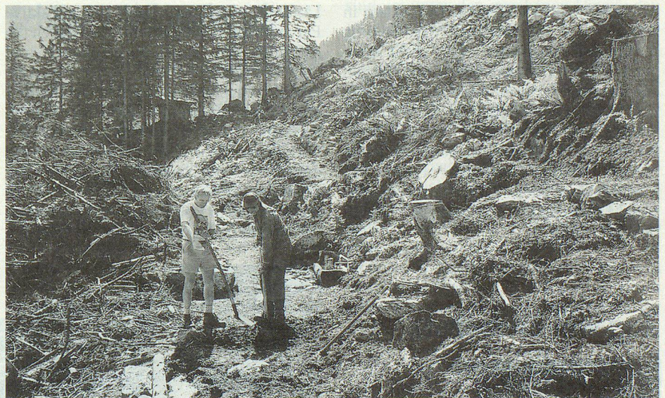
Chaos allenthalben. Die Zivilschützer mussten die Wege erst freilegen.

im Einsatz zur Behebung von Lawinenschäden. Es galt, Flurschäden zu beheben, Wander- und Höhenwege zu räumen und wieder begehbar zu machen sowie Alpweiden zu säubern. Die Arbeitsplätze lagen in 1200 bis 1800 Metern Höhe. Im steilen Gelände waren das schweisstreibende und zum Teil nicht ungefährliche Arbeiten. ms.