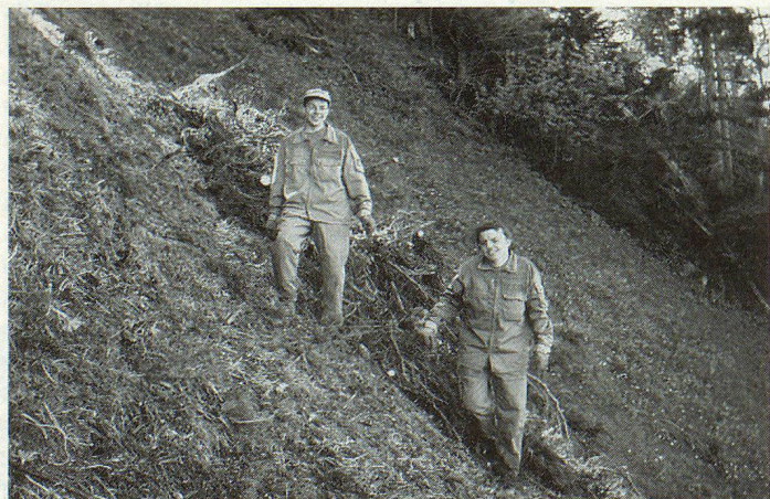
Hier ein Beispiel. Kulturland im steilen Gelände aufräumen war unter anderem eine Aufgabe der Zivilschutzorganisation aus dem Bündnerland.