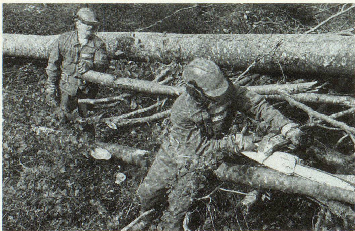
Nidwaldner Zivilschutz mit moderner Ausrüstung. Unzählige Kettensägen mussten eingesetzt werden.

Die Aufräumarbeiten gestalteten sich vielfältig und anspruchsvoll und richteten sich nach den vordringlichsten Bedürfnissen. In der ersten rund einen Monat dauernden Phase stand die Schadenbehebung im Kulturland im Vordergrund. In der zweiten Phase ab 1. Mai ging es um Wiederinstandstellungsarbeiten. Es mussten Wege freigelegt, Bachläufe gesäubert und Wurzelstöcke im steilen Gelände gesichert werden. Zum Teil war die Arbeit nicht ungefährlich. Vor allem die Arbeit im steilen Gelände forderte selbst robuste Kerle bis an die Grenzen ihrer Kräfte. Laut dem kantonalen Einsatzkoordinator Urs Imboden herrschte jedoch unter den Einsatzkräften eine mustergültige Solidarität. Es gab auch