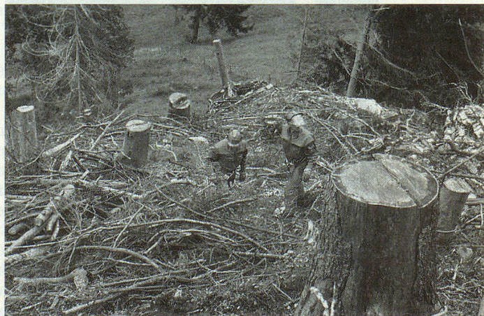
Wurzelstocksicherungen durch Zivilschutzangehörige im steilen Gelände, damit diese nicht auf die Wiesen rollen und eine Gefahr bilden.