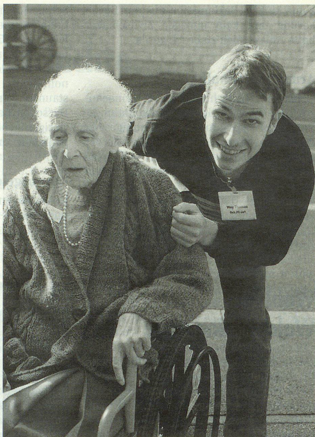
Mit guter Laune geht alles doppelt gut.