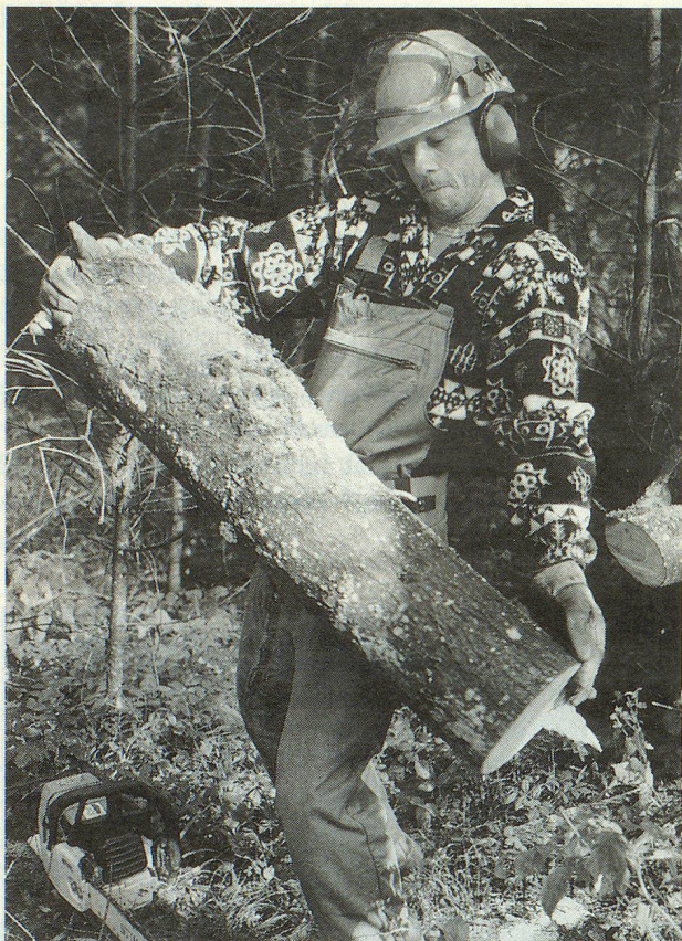
Auch für einen kräftigen Zivilschützer ein happiger «Lupf».