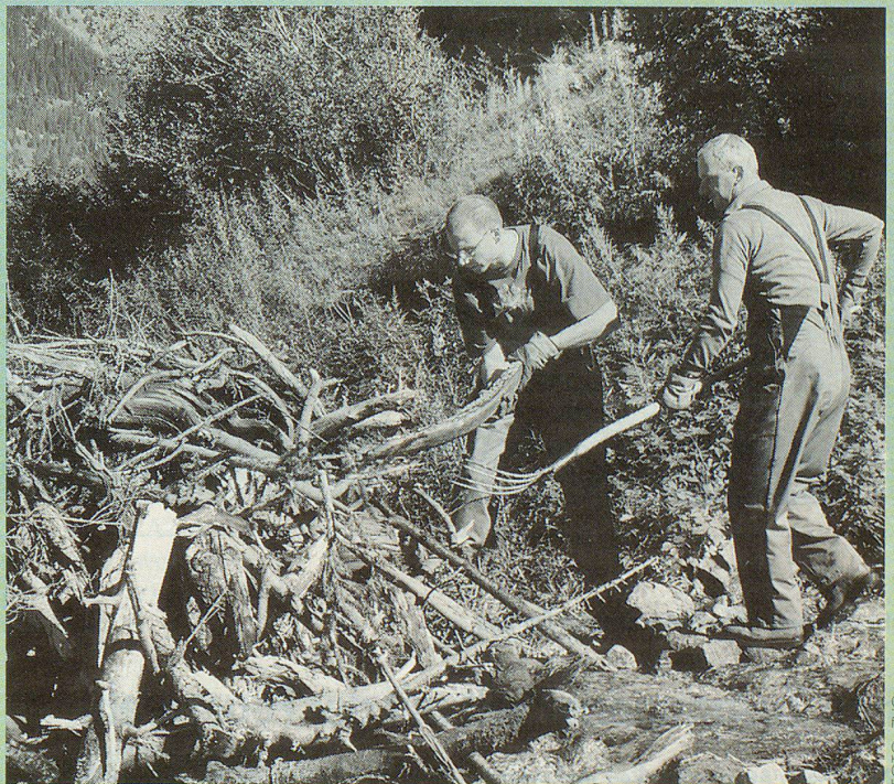
Ein Bild aus besseren Tagen, Schlierener Zivilschützer im solidarischen Hilfseinsatz im Wallis.