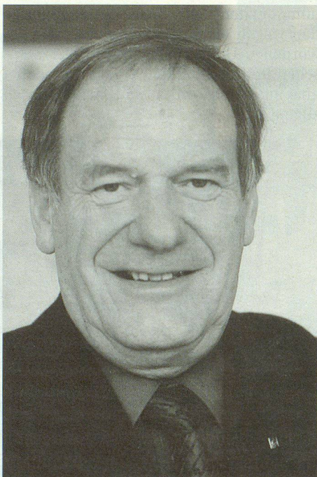
Oberst Hans-Rudolf Hasler: «Die Entwicklung des AAL geht in Richtung einer militärischen Fachhochschule.»

Die Eröffnung des AAL war ein Meilenstein in der Schweizer Militärgeschichte. Nach der Ära der «Eidgenössischen Central-Militärschule» in Thun von 1819 bis 1863 wurde die Ausbildung der Armeekader auf verschiedenen Waffenplätzen betrieben. Ein für die heutigen Anforderungen unhaltbarer Zustand. Freude über das gelungene Projekt bekundete Divisionär Jean-Pierre Badet, Kommandant des AAL. «Nach jahrzehntelangem Herumreisen können die höheren Kader der Milizarmee ab Stufe Bataillon aufwärts bis zu den Kadern der