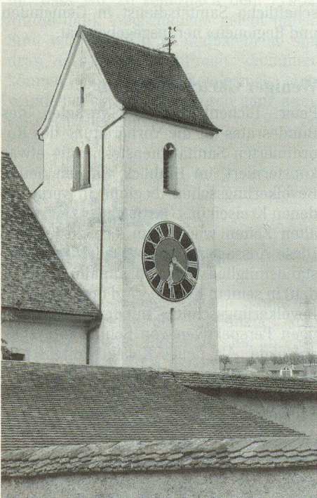
Der markante Käsbissenturm der Pfarrkirche Wölflinswil.

Bei einer Gesamtrenovation der Pfarrscheune bestünde die Aussicht, dass alles unter eidgenössischen Denkmalschutz gestellt würde. Vorerst jedoch bleibt anderes zu tun.