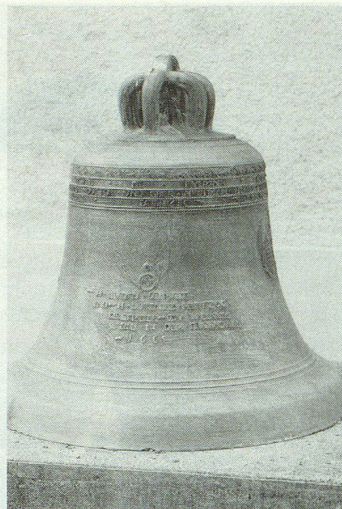
Die Glocke mit der Jahrzahl 1665.