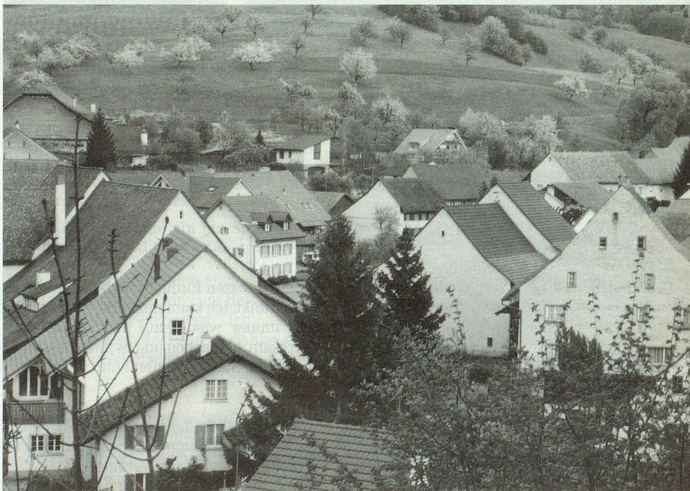
Blick auf Wölflinswil mit seiner behäbigen Bausubstanz.

Wölflinswil ist eine Gemeinde mit wechselvoller Vergangenheit. In früheren Jahrhunderten wurde in der Gegend Eisenerz gefördert. Dadurch gelangte der Ort zu einem gewissen Wohlstand. Das ist noch heute sichtbar an markanten, grundsoliden und behäbig wirkenden Gebäuden, die eine alte Wohnkultur verraten. Der Dreissigjährige Krieg (1618 – 1648) brachte dann einen argen wirtschaftlichen Einbruch. Im 19. Jahrhundert und bis in die ersten Jahrzehnte des 20. Jahrhunderts florierte die von der Mode diktierte Seidenbandindustrie. Die Boten reicher Basler Industrieller brachten das Rohmaterial und holten die fertigen Produkte ab. Noch heute ist im alten Spritzenhaus am Dorfplatz ein Webstuhl zu sehen, der an beson-