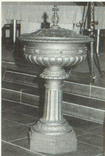
Ein seltenes Stück: Der alte Taufstein aus Gusseisen.