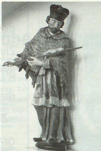
In einer Nische der Bückenheilige Johannes Nepomuk.