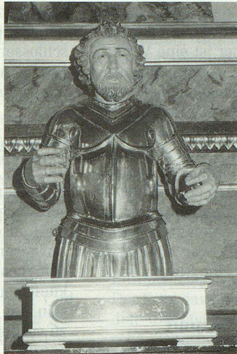
Kulturhistorisch am wertvollsten sind Reliquiare, vermutlich aus dem 17. Jahrhundert.