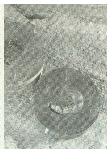
Nagra, Benken ZH: «Leioceras opalinum».

Fossilfund: 179 Millionen Jahre im Opalinuston eingeschlossener Ammonit.