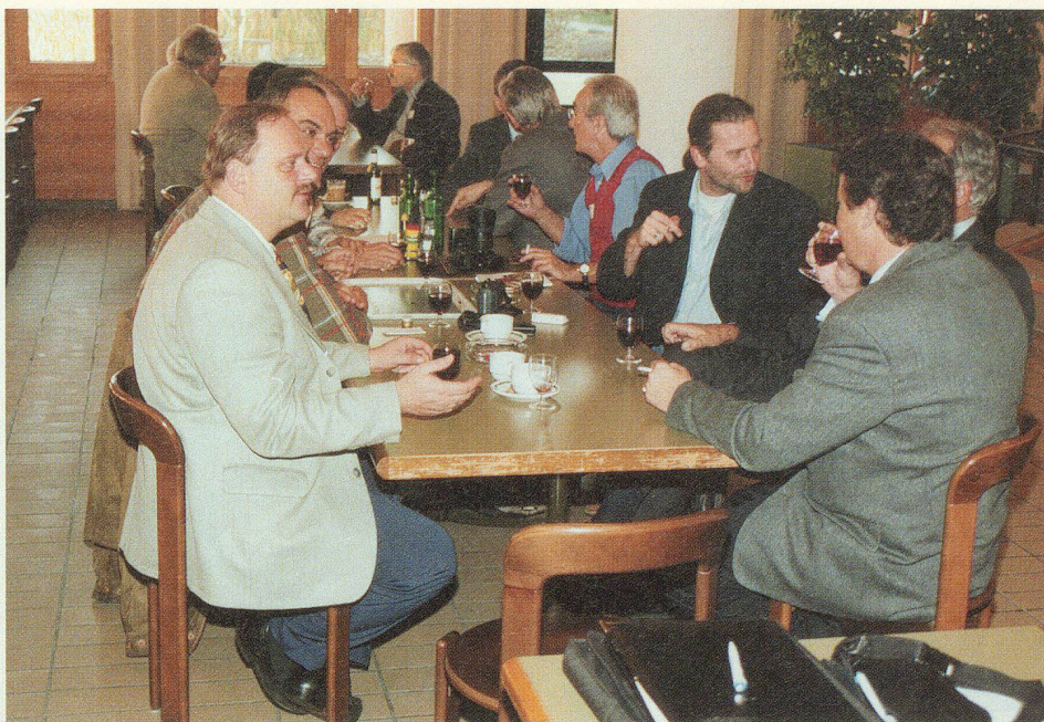
Angeregte Diskussion vor und nach dem Mittagessen: