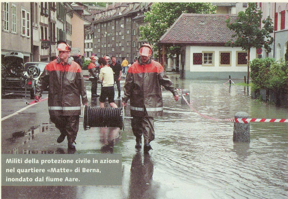
Militi della protezione civile in azione nel quartiere «Matte» di Berna, inondato dal fiume Aare.

Tutti i corsi di ripetizione, indipendentemente dal grado gerarchico dei partecipanti, richiedono molta fantasia per offrire ogni volta un'istruzione molto vicina alla realtà.