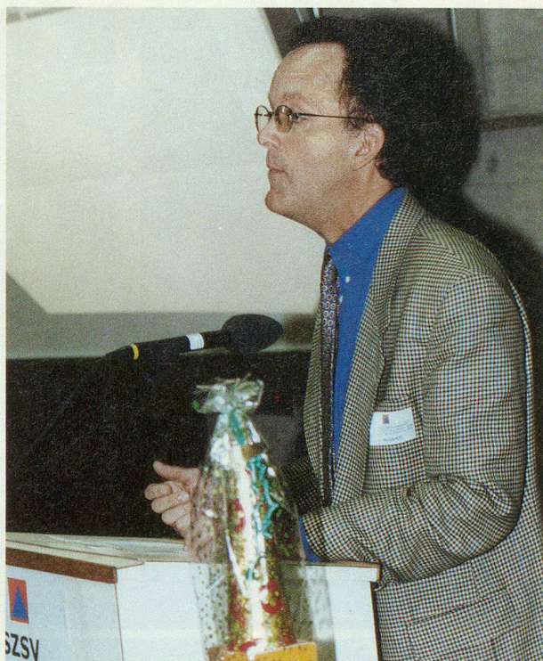
Jacques Bujard, Konservator und Chef der Denkmalpflege des Kantons Neuenburg, erläuterte in einem straffen, aber aussagekräftigen Referat die Kulturgüter und deren Schutz im Kanton.