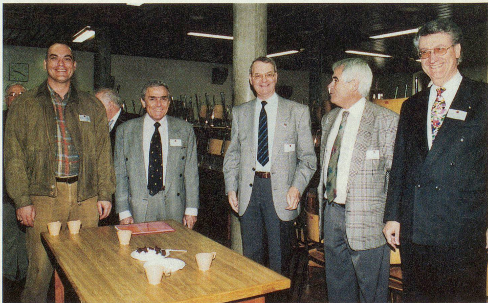
Les présidents des sections de la Romandie à l'heure du café.