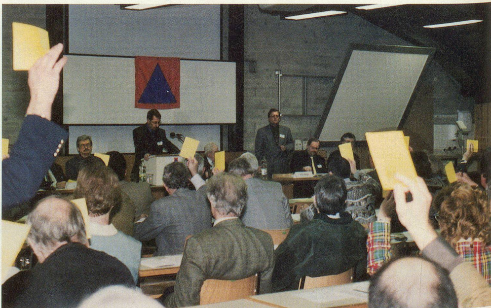
Les délégués acceptent le budget 2001 proposé par le Comité.