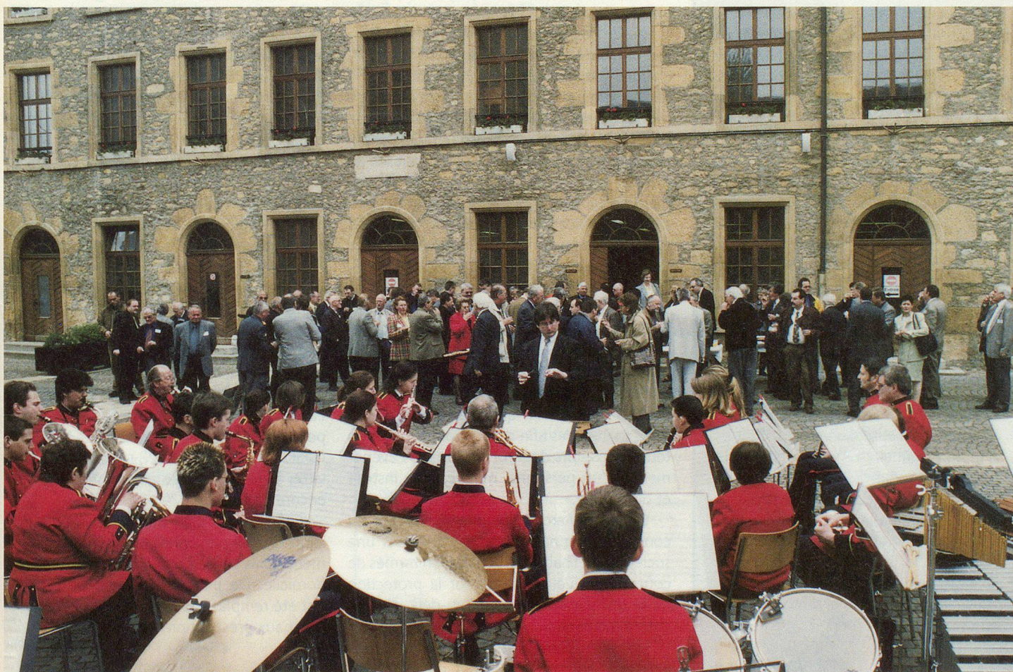
L'aubade de la fanfare militaire de Colombier.

La prochaine assemblée de l'Union suisse pour la protection civile devrait se tenir quelque part dans le canton de Berne, le samedi 4 mai 2002. □