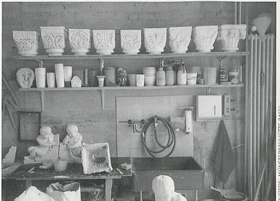
Dès Antiquité, on a constitué des collections importantes à des fins d'étude, et il n'est pas rare que ces copies soient un jour presque aussi précieuses que les originaux.