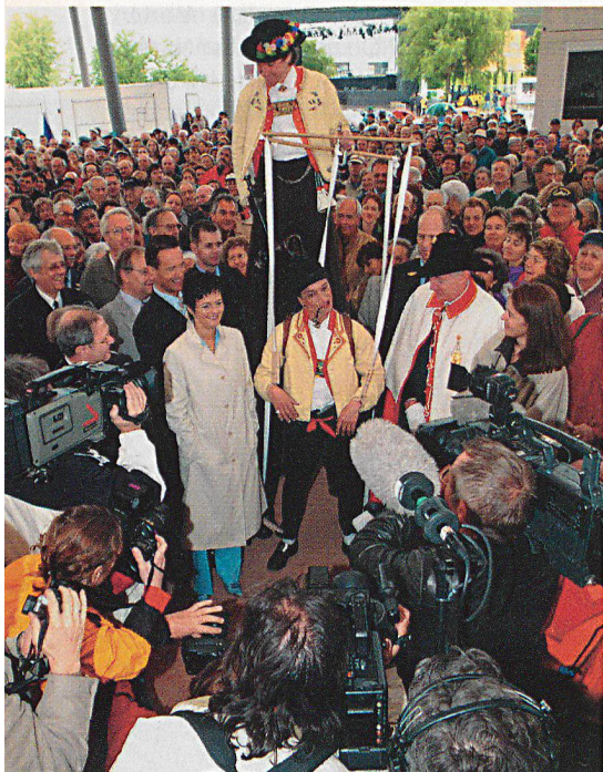
Selbstredend besuchte auch Bundesrätin Ruth Metzler den Appenzeller Kantonaltag – sichtlich angetan von der Begrüssung des Stelzenmannes.

Der Autor des Beitrags wirkte am Kantonaltag als Logistikkordinator mit. □