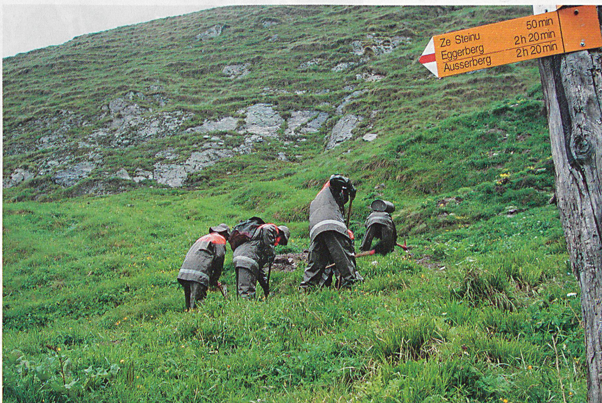
In der Regenkleidung harte Arbeit im steilen Gelände auf der Alp Erl.