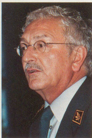
Pour le médecin-chef de l'armée, le nouveau système garantit une investigation complète et personnalisée.

Quant au recrutement de la protection civile, action consacrera un article complet dans un prochain numéro. □