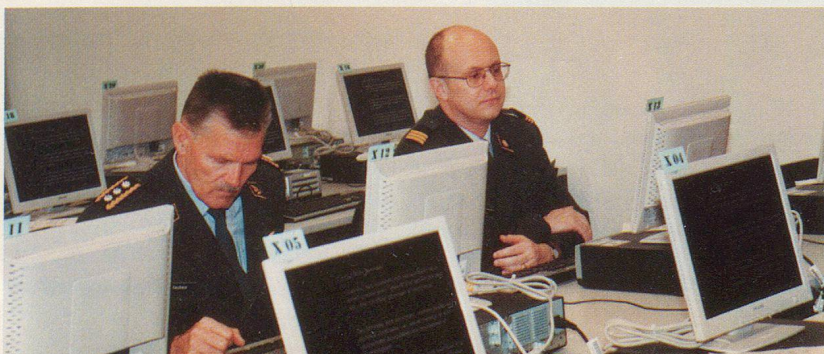
Les résultats des tests sont classés «secret-défense»...