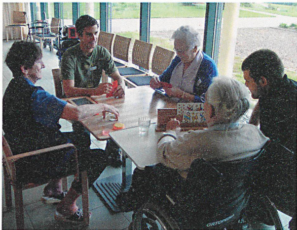
Jassen – über Generationen hinweg.