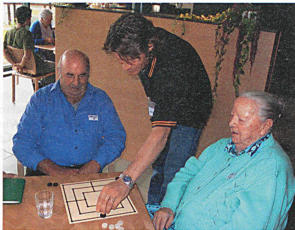
Teamwork: junge Hände helfen beim Mühlespiel.

WERTVOLLE ERFAHRUNGEN IM ALTERS- UND PFLEGEHEIM