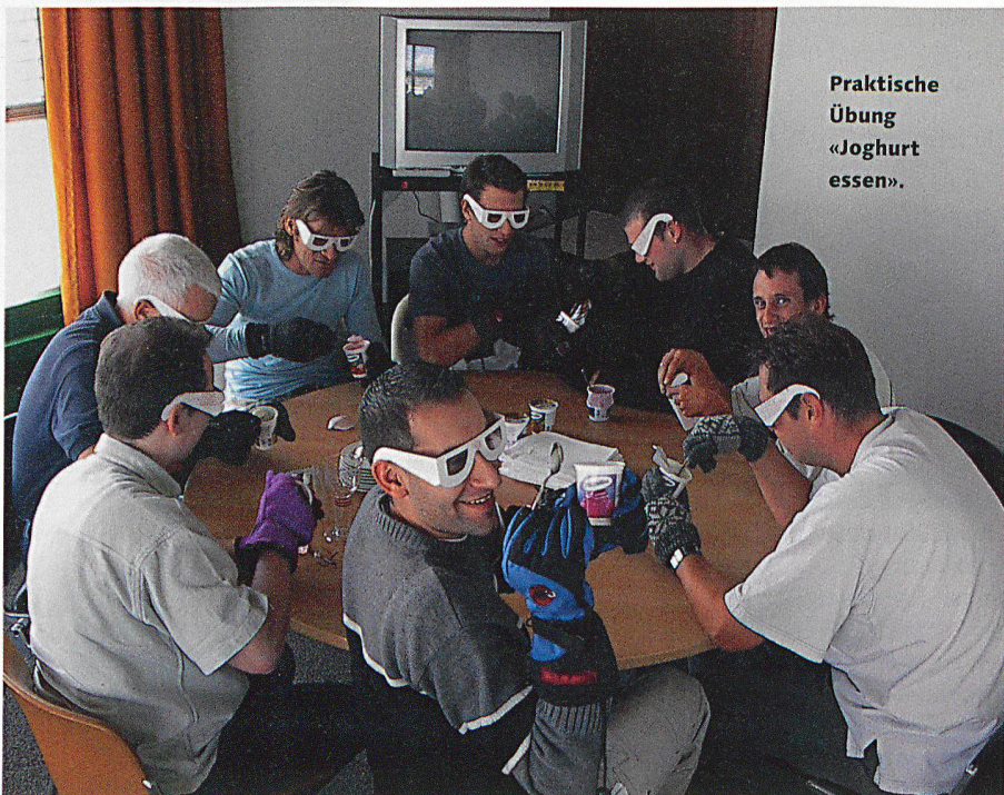
Praktische Übung «Joghurt essen».

Geduld, Fingerspitzengefühl und auch etwas Gewitztheit sind Eigenschaften, welche ein gutes Pflegepersonal ausmachen. Das ler-