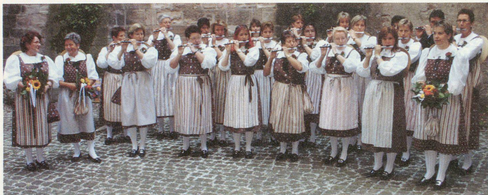
Die Delegierten werden beim Apéro durch «baslerische Musikklänge» begleitet.

(Österreich) abgeschlossen worden seien. «Ein analoges Abkommen können wir vielleicht mit dem Fürstentum Liechtenstein im kommenden Jahr feiern, wenn die SZSV-DV im «Ländle» stattfinden wird», meinte Widmer mit einem Schmunzeln.