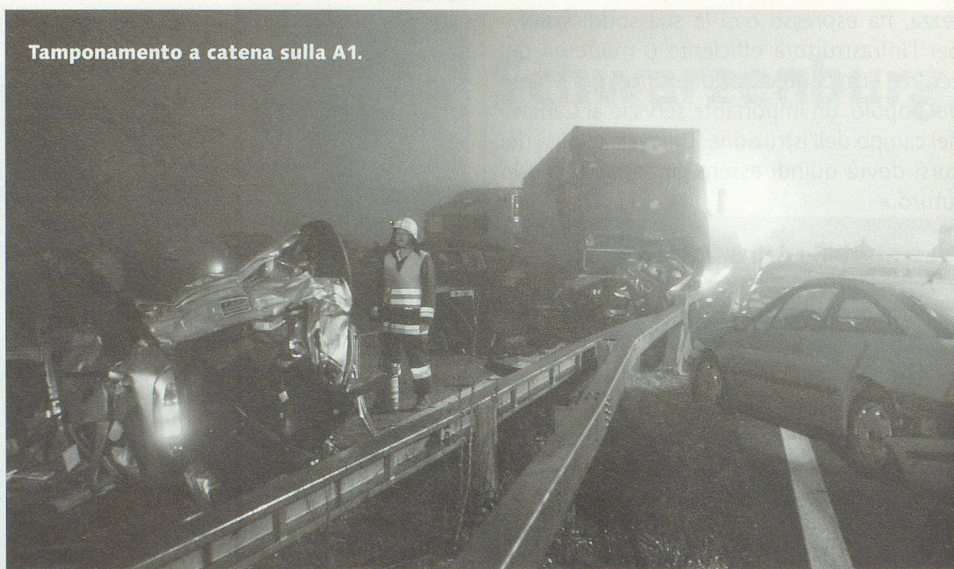
Tamponamento a catena sulla A1.

Nel Concetto direttivo della protezione della popolazione e nell'articolo 5 della Legge federale sulla protezione della popolazione e sulla protezione civile (LPPC), la Confederazione viene incaricata di preparare un organo di coordinamento e di condotta del servizio sanitario e mezzi supplementari per far fronte a catastrofi e situazioni d'emergenza con un elevato numero di pazienti (epidemie, terremoti, contaminazione radioattiva e conflitto armato).