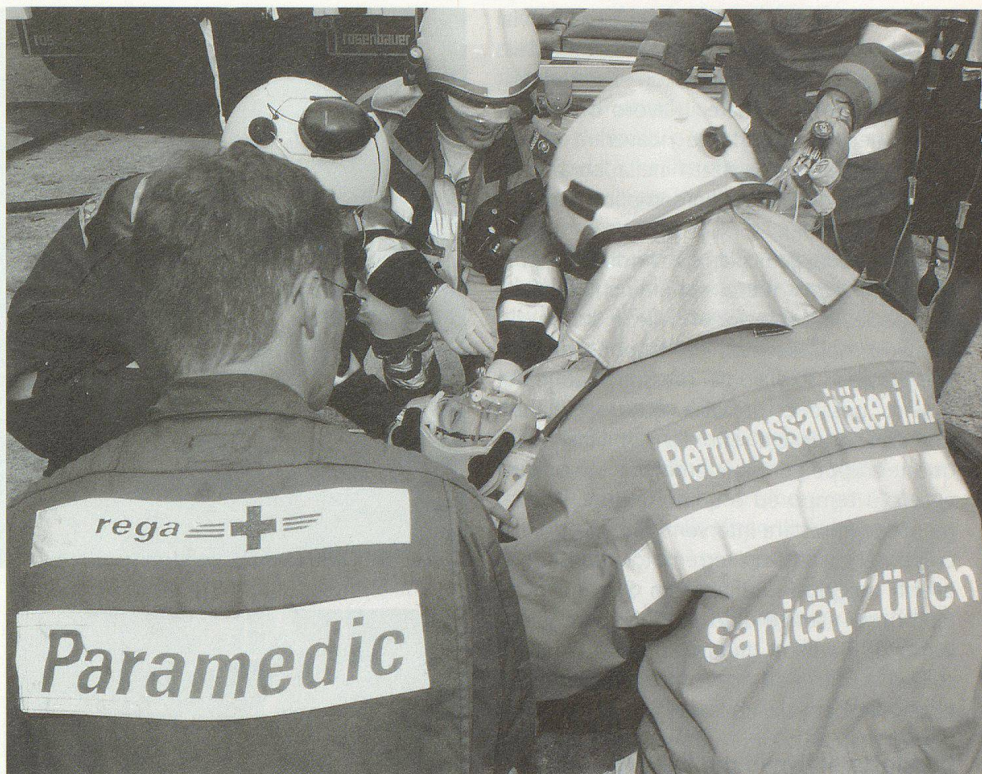
Il personale professionale dei servizi di salvataggio, dei servizi autoambulanze e della REGA (medici, medici d'urgenza, sanitari) si occupano dei feriti sul luogo del sinistro.