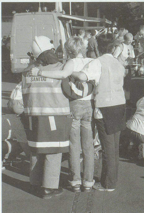
Sul luogo di un sinistro i pazienti vengono assistiti anche da soccorritori laici come i samaritani.

Questo organo di coordinamento, richiesto da tempo ma mai realizzato, è ora statuito nell'Ordinanza sul servizio sanitario coordinato: • L'OCSAN assiste l'incaricato SSC in tutte le questioni sanitarie e gli offre consulenza sui compiti d'importanza strategica. • L'OCSAN assume, per ordine del Consiglio federale, il coordinamento a livello federale in situazioni particolari e straordinarie nonché nel caso di conflitto armato.