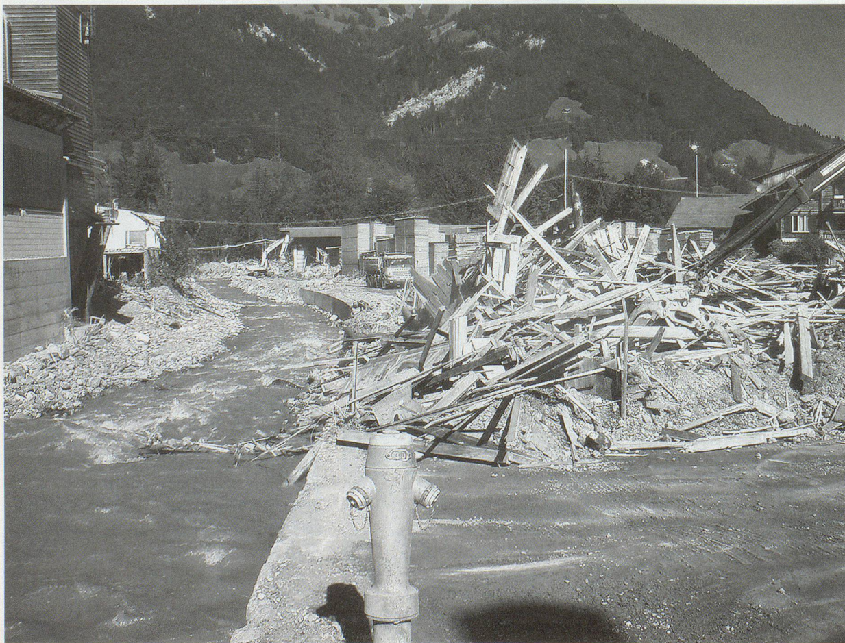
Viel Geröll in Reichenbach.