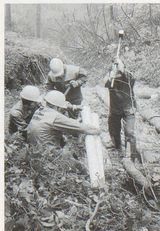
Zivilschützer arbeiten im Gebiet Leimen (Gemeinde Langnau) an einem so genannten Energierichter für den Bach.

Überhaupt zog die Führung der Zivilschutzorganisation Region Langnau eine überaus positive Bilanz des Nothilfeinsatzes. Die gesteckten Ziele seien allesamt erreicht worden – und dies erst noch ohne Unfall. Zum Erfolg beigetragen hätten auch das gute Wetter und die 36 Mannschaftstransportfahrzeuge, welche die Armee kostenlos zur Verfügung gestellt hatte. Um die 8000 Kilometer wurden während diesem bisher grössten Nothilfeinsatz einer einzelnen Zivilschutzorganisation im Kanton Bern zurückgelegt. □