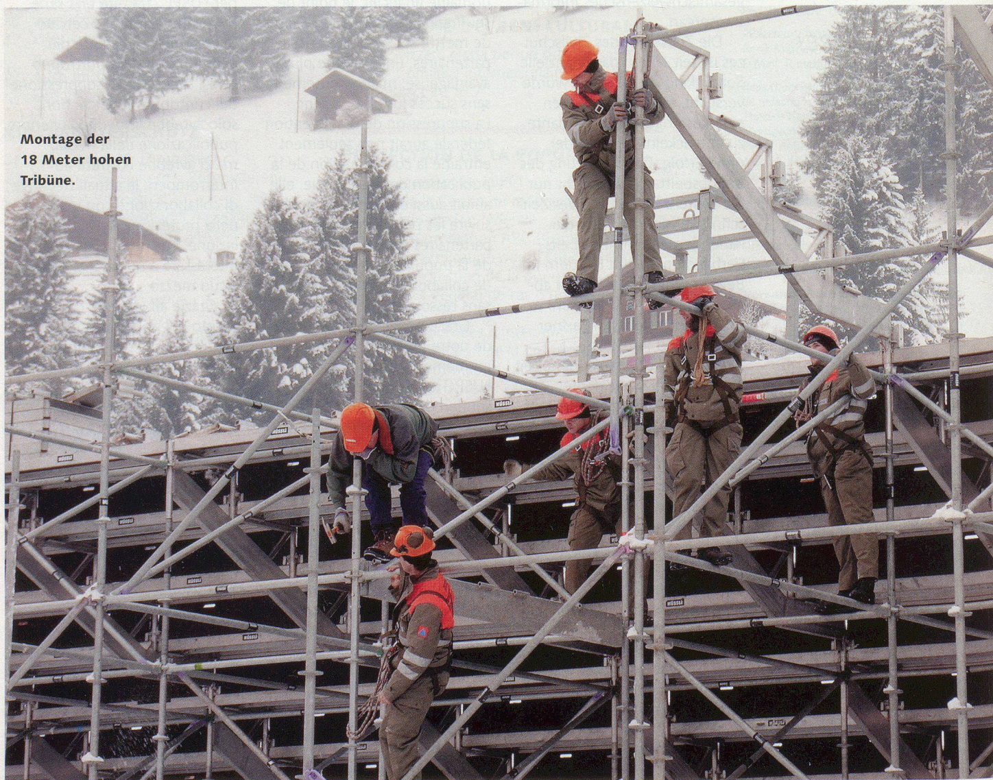
Montage der 18 Meter hohen Tribüne.