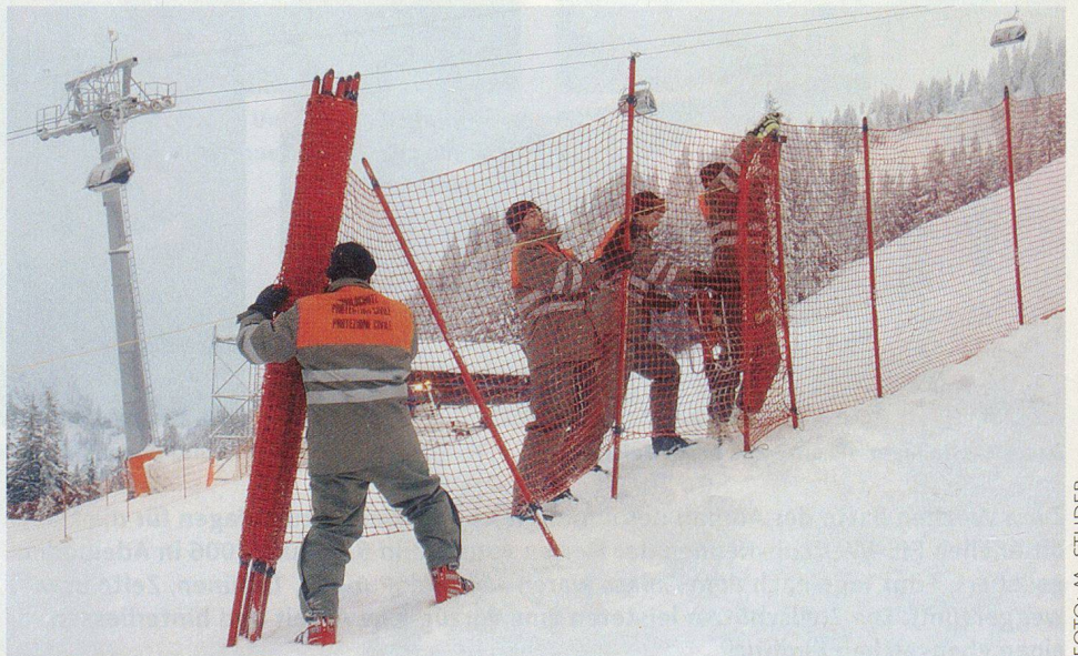
Einige der 15 000 Laufmeter Abschrankungnetze.