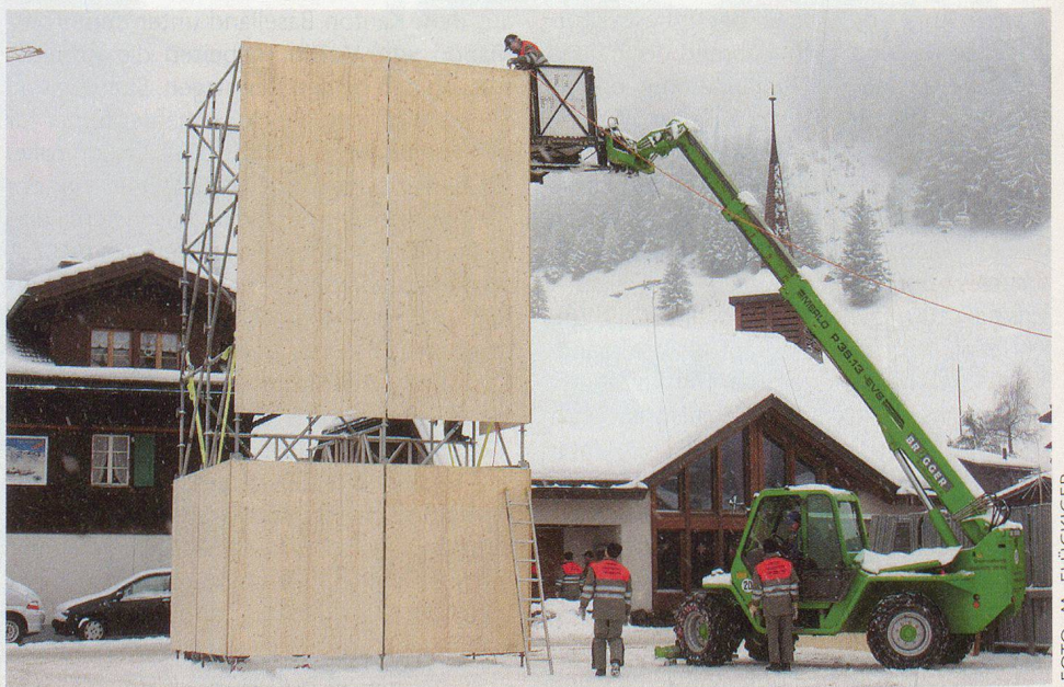
Grosse Maschinen für grosse Lasten.