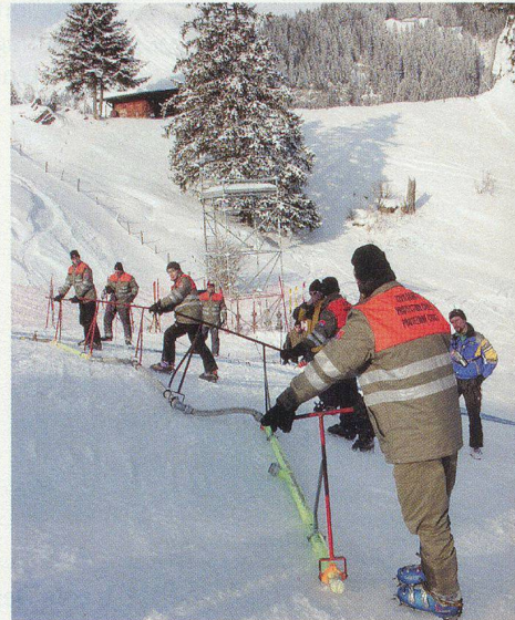
Einsatz für sichere Rennen.