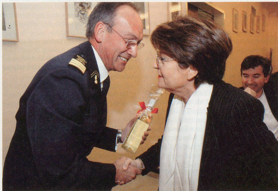
Un chaleureux au-revoir à Micheline Spoerri, conseillère d'Etat.

Comme prévu, les effectifs de la protection civile continuent à diminuer puisque avec 6629 astreints ou volontaires instruits, dont 75 femmes, nous constatons une diminution de 1516 personnes par rapport à l'année passée. L'effectif estimé pour Genève, dans le cadre de la PCi XXI, est d'environ 5000 personnes.