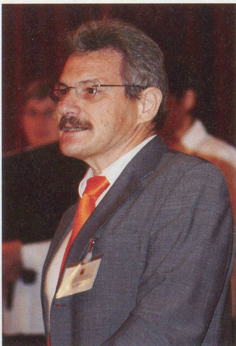
Alfred Vogt, Amtschef des Fürstentums.

Die Delegiertenversammlung des Schweizerischen Zivilschutzverbandes (SZSV) vom 13. Mai im liechtensteinischen Balzers kam dank der Einladung des Amtes für Zivilschutz und Landesversorgung des Fürstentums zustande, zu dem der SZSV seit Jahren beste Beziehungen unterhält.