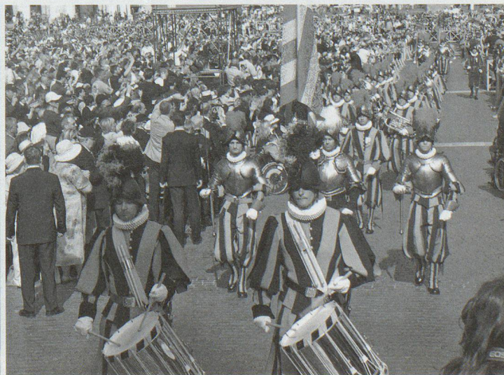
Bild links: Der Schwur auf die Fahne der Garde. Bild rechts: Einmarsch des Gardegeschwaders über die Piazza San Pietro vor die Basilika.