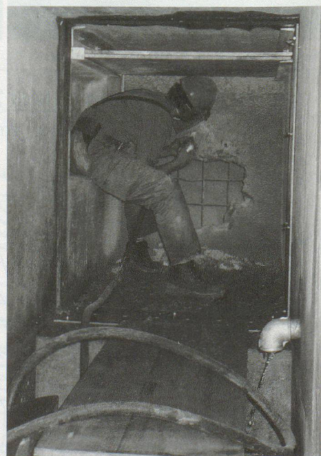
Der Stollen ist eng, die Arbeit darin anspruchsvoll. Im Vordergrund der Wassergraben, über dem Zivilschützer schwere Eisenplatten für Abstützungen.

Die ersten Ideen für einen neuen, massgefertigten Übungsstollen nahmen vor rund vier Jahren Gestalt an. Für die Planung und Realisierung wurde dann im Auftrag des kantonalen Hochbauamtes ein Flawiler Ingenieurbüro beigezogen. Dieses verfügt über einschlägige Erfahrungen bei komplexen Spezialbauten. Mit dem Bau begonnen wurde Ende März dieses Jahres – unter tatkräftiger Mitwirkung des Zivilschutzes. Anderthalb Monate später war die Anlage betriebsbereit. □