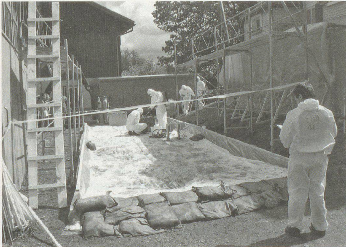
Einrichten einer Schleuse und Dekontaminationsstelle für Menschen und Fahrzeuge.