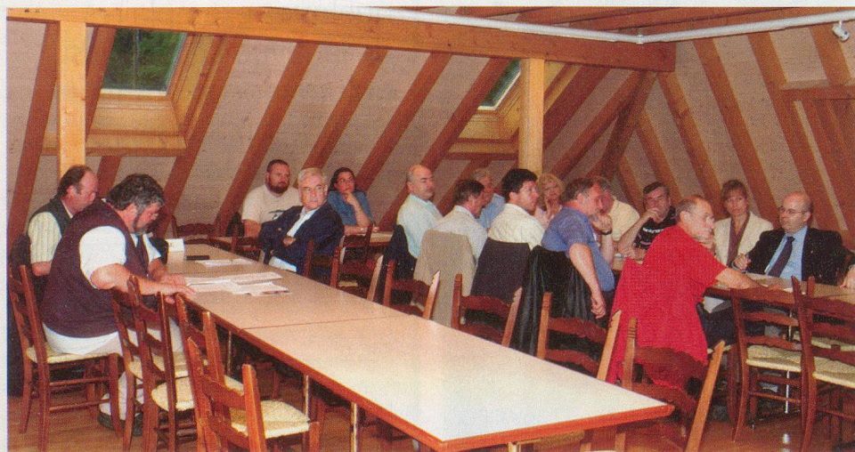
Une salle clairsemée... mais attentive.