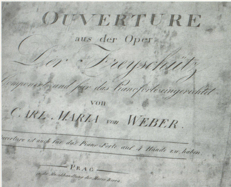
Beispiel aus den mit der schweizerischen Gefrier-trocknungsanlage behandelten handschriftlichen und gedruckten Notensammlungen. Tschechisches technisches Museum, Brünn.

denfall praktisch keine anwendbaren Verfahren im europäischen Raum abrufbar waren. Einzig auf die Erfahrungen von Florenz im Jahre 1966 konnte man damals zurückgreifen. Dies bestärkte die tschechischen Partner in der Idee, in Brünn ein eigenes regionales Kompetenzzentrum aufzubauen.