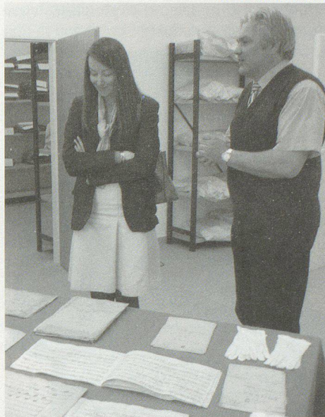
Spartiti manoscritti e stampati trattati con l'impianto di liofilizzazione svizzero. Museo tecnologico della Repubblica Ceca, Brno.